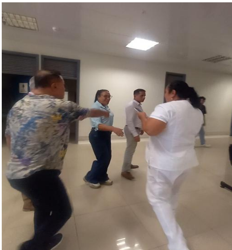
✓ Video 3. Denominado Visita al hospital – Ingresando 2